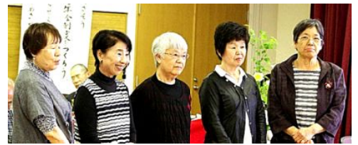
退任された皆さん