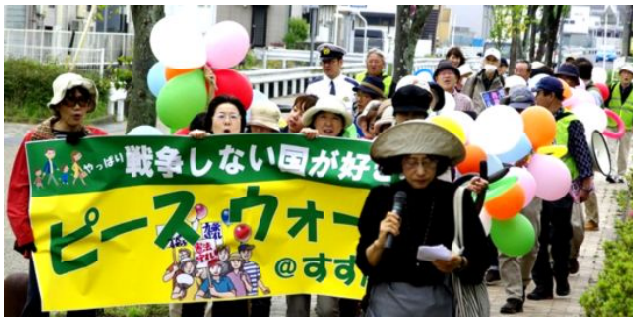
強風下のピースウォーク