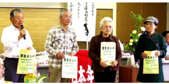
熊本地震緊急カンパの訴え