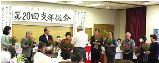
仲間づくり感謝状贈呈