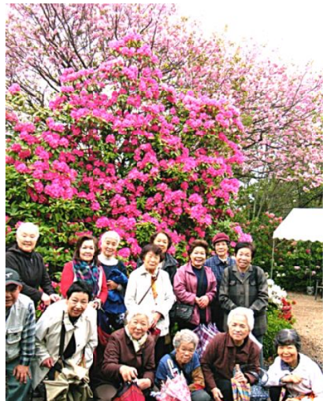
シャクナゲをバックに

4月21日(木) 今にも雨が降り出しそうなき模様を気にかけながら、19名で赤塚植物