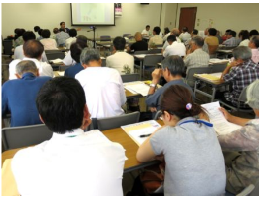
県社保協交流セミナー

最後に、鈴鹿社保協の運動 を広げていく為に、その費用 としてカンパをお願いしたと ころ1万6083円のカンパ をいただきました。ありがと うございました。