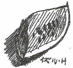
イラスト 樋口 出

材料 ①西瓜 600g (皮付きで) 塩少々 ②粉ゼラチン 10g、水 大さじ4 ③砂糖 120g 水 400cc ④レモン汁大さじ1 オレンジキュラソ大さじ1