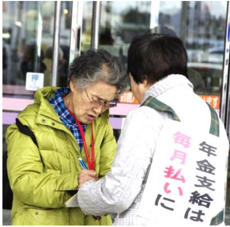
一斉宣伝 署名ありがとうございます