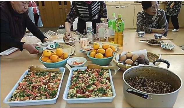
美味しくできました