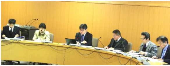
12月議会地域福祉委員会の審議

「昨日久し振りに確かめたら減っていた。」という声と署名が38筆寄せられました。次回は2月支給日の前後です。一度参加して、市民の皆さんと会話されては如何でしょうか。