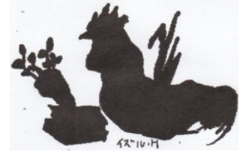
イラスト 樋口 出

材料 (4人分) もち6個 鶏むね肉120g かぶ2個 にんじん80g しめじ1パック ねぎ1/2本 にら1/2束 A(おろしにんにく1欠片 コチジャン大さじ1~2 粉唐辛子小さじ1/2~1) B(しょうゆ大さじ2 みりん大さじ2 砂糖大さじ1/2) だし汁(煮干し)5カップ 油 ごま油