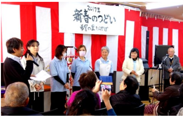
新春のつどい

いたように、安倍さんはマスコミのエライさんと頻繁に会食している、「戦争はウソから始まり国民をだまして、自分たちの利益のみを追求する者たちによって行われる。私たちは本当の事を知るように努力し、マスコミにだまされないようにせねばならない」と。