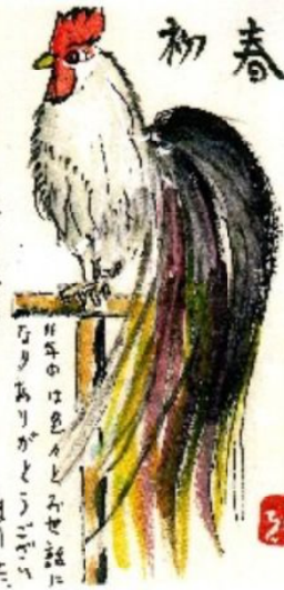
今年も佳き年でありました。今年の色々とふせ絵に「初春」ありがとうございました。平成二十九年 元旦

なシンケイすいじやく、ババ抜きをして、七並べで負ける。「もうやめた」で終わってしまいます。父母の仕事帰りが遅くなる時は、迎えに行っているお爺さんが、時々帰りにお店により、おやつを買っています。保育園を休んだときでも、お店に行こうと言って、お菓子を2〜3個買って帰ってきます。孫には「お爺ちゃんです」。孫の顔を1週間見ないとさびしそうに見えます。孫と遊んだ後は疲れが出るみたいです。でも孫から元気をもらっています。頑張れ爺ちゃんと孫が言っているようです。