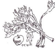
イラスト 樋口 出

作り方 ①春菊は熱湯に塩少々を加えて、2分ほどゆで、水にとって水気を絞る。3cm長さに切り、しょうゆ小さじ1をまぶして絞る。 ②鶏ささみはゆでて細くさく。 ③しめじは石づちを取ってほぐし、こんにゃくは塩もみをして洗い、2cm長さのたんざく切りにする。にんじんも同様に切る。 ④鍋にAを合わせ③を入れてふたをし、弱火で7~8分煮る。火を止めて粗熱が取れたら、①と②も浸しておく。 ⑤豆腐を裏ごししてボールに入れ、Bを加えて、泡立器でよく練り混ぜ、④の煮汁を適量加えて、衣のかたさと味を調える。 ⑥りんごは、1cm角に切り、④は汁気を絞る。⑤に混ぜる。