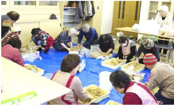
味噌づくり