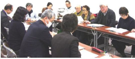
社保協と市・広域連合との懇談の様子