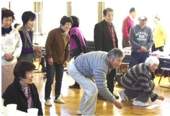
誕生会 キャップカーリング