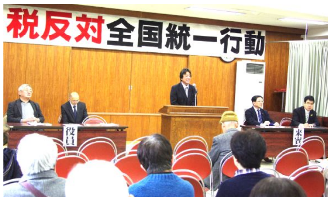
集会の様子

鈴鹿民商と年金者組合共催で、鈴鹿建設労組ホールで行われました。民商小川会長と年金者組合桑原支部長の挨拶、両事務局からの報告の後、恒例の抽せん会があり、景品の商品券が当たった人は満面の笑みを浮かべていました。