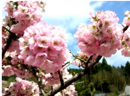
大輪の横輪桜

名物の横輪風が強い中、花は優しく豪華に迎えてくれました。半開きの大きな蕾の房は、私たちの心まで濃いピンクに染め上げ、幸せにしてくれました。