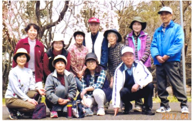
グランドゴルフ

次回は、5月17日(水)午前9時から、雨天時は5月19日(金)になります。場所はフラワーパークです。(松田 二郎 記)