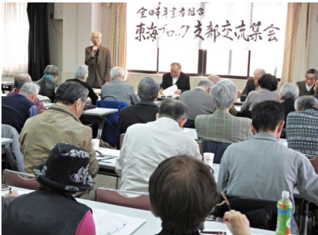
全体集会