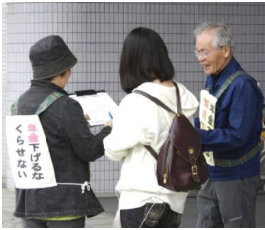
署名と話し合い