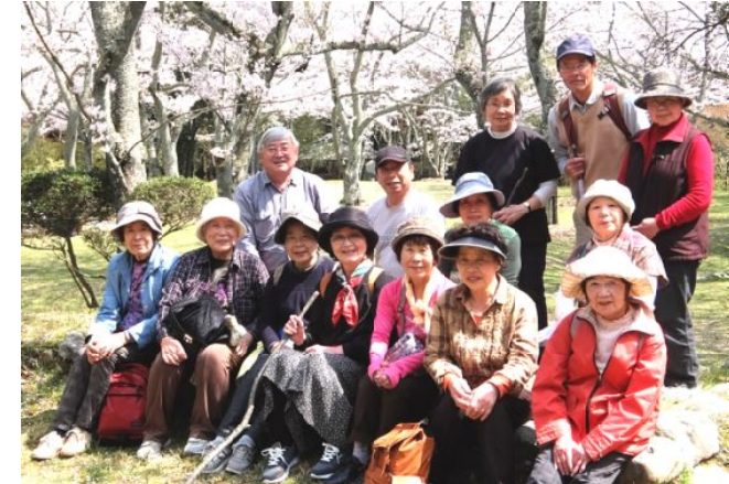
史跡めぐりの会