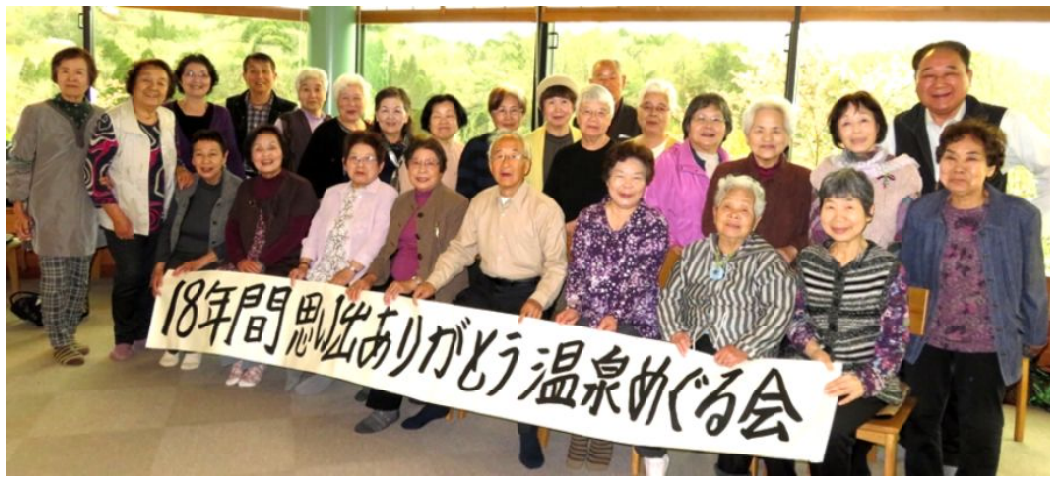
温泉の会