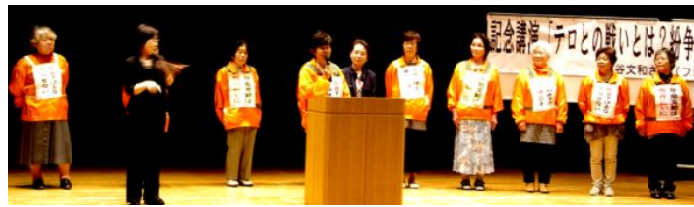
鈴鹿支部女性部の活動報告

6月4日伊勢トビアで、三重県母親大会が開催され、鈴鹿から貸切バスに乗り参加しました。鈴鹿年加しました。四月九日、じゃがいもの種を植えようと草を取った。膝まで伸びて草は枯れているが、株元には青い草が立ち上って生えている。その草をねそぎに取っている。草を取っていると、土の中にいた虫や蚯蚓が慌てて逃げてゆくと、蚯蚓はじきはねておどろく。この騒動を見ていたのだ、椋鳥が幾羽も飛んできて、虫を食べ蚯蚓を食べる。椋鳥の巣には、孵化した雛