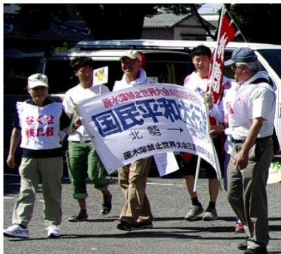
左端筆者