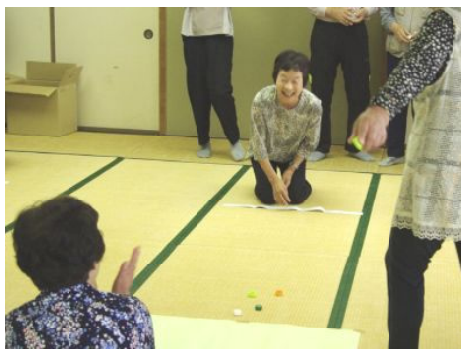
キャップカーリング