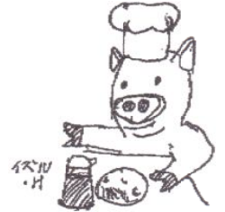
イラスト 樋口 出