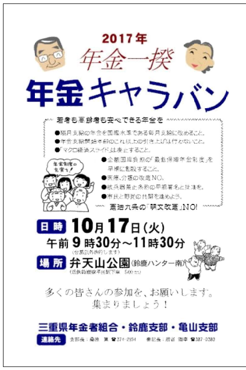
「年金キャラバン」の支部作成チラシ

例年「年金一揆」の名前で、県下6地区で、展開します。取り組んできた秋の要求行動を、今年も、「年金キャラバン」として、10月16、17日に、 同で、11月17日(火)9時30分～11時30分、弁天山公園