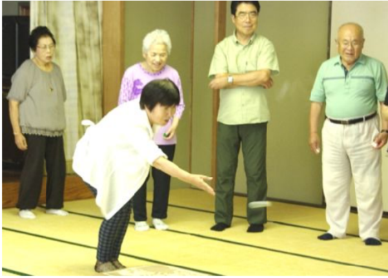
誕生会キャmpアップカーリング