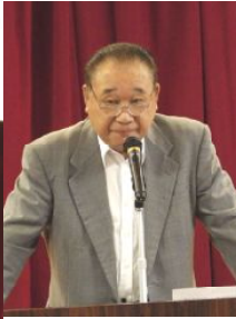
井辻 報告 辻左 挨拶 井右 報告 辻左 挨拶