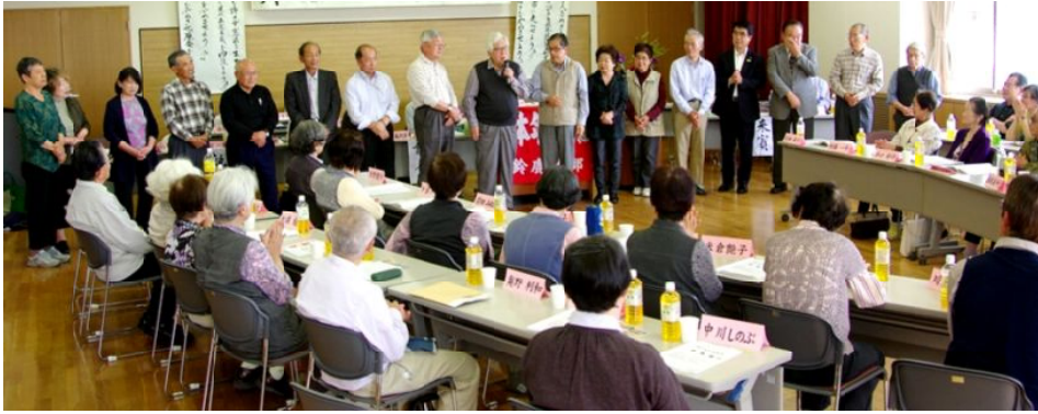
新役員挨拶

4月27日に総会が無事終わりました。新しいスタッフの皆さん、そして全ての皆さん、今年度もどうぞよろしくお願ひします。 年金者組合は、一人暮らしの人を無くし、みんなで繋がり合い、楽しく生き生きと人生を送ることを目的として生まれました。このことをいつまでも忘れず力を合わせて活動していきたいと思ひます。