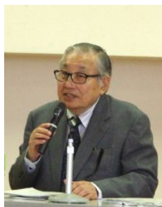
森英樹さん

早速、5月15日に、第1回の仲間づくり推進委員会を持ちました。総会后2名の方がやめられましたが、1名新しく加入されますので現在20