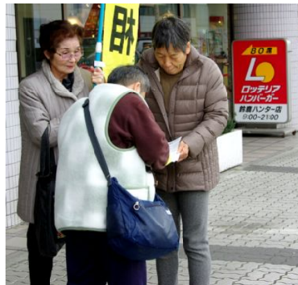
署名活動

支給日一斉宣伝の署名活動を行いました。その日は北風が吹き抜け、とても寒くて、震えながら立ち、大きな声で「年金下げるな」の署名活動を行っています。」と張り上げて、寒さを吹き飛ばしている、以前と同じ場所