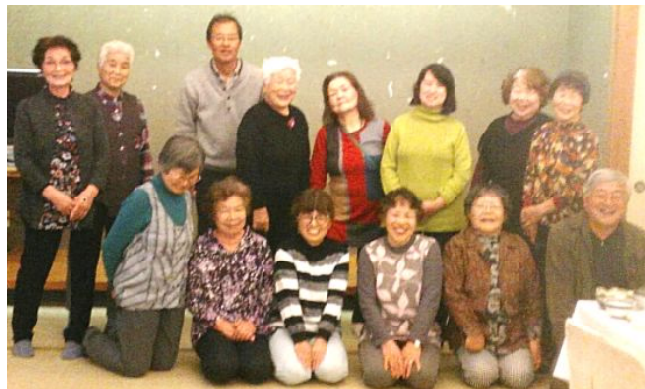
忘年会参加のみなさん