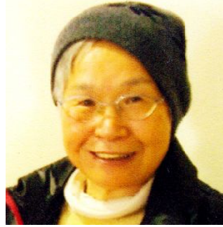
卓球サークルの開始前に