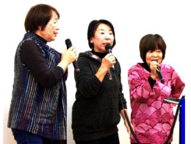
カラオケ 2