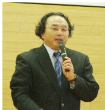
長峰教授

前者については、現憲法制定過程において日本人学者(憲法研究会)による素案がGHQ側に高く評価され、それを下敷きとして採用された事実。後者については、北朝鮮のミサイル実験などを、ことさら脅威に仕立てあげ防衛費を増大させ莫大な武器を買い口実作りであり、政府が本気で北朝鮮が攻撃してくると信じているなら、原発再稼働を日本海側(泊、柏崎、敦賀等々)に進める筈がないことなど資料に基づき話された。