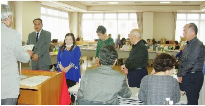
仲間づくり感謝状贈呈

第23回支部総会は、4月26日13時から、ジェフリーで、組合員59人(委任状91人)、来賓6人が参加し、全議案を圧倒的多数の賛成で可決して、成功裡に終わりました。オープニング「みんなでおう」で、「かけがえのない