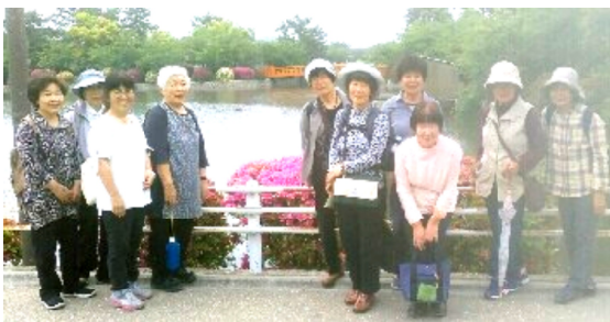
九華公園にて

広大な公園はかつて桑名城があったところ。幕末から明治の戊辰戦争で敗れ朝敵になった桑名藩。明治政府に何もかも壊され、石垣の一部は四日市港の整備に使われたという話です。公園をぶらぶら散策