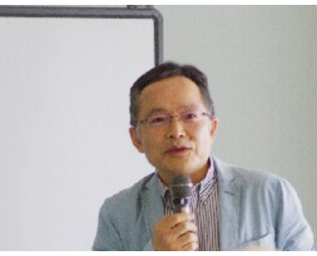
笹沼教授

とを指摘して、日本国憲法が「セーフティーネット」の役割を果たしているが、「生活保護を受ける人のためだけでなく、全ての国民が自由に幸福を追求して生きる権利を平等に保障している」と述べま