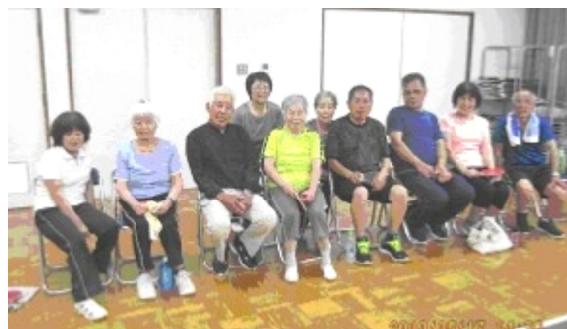
休憩時のみなさん