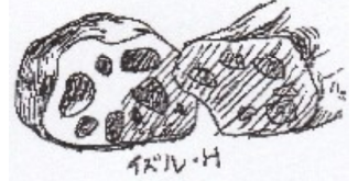
イラスト 樋口 出

作り方 鶏肉は、余分な油部分を取り、1口大に切る。ポリ袋に入れて、塩小さじ1/4をもみ込んで小麦粉をまぶす。 フライパンにごま油を入れ、鶏肉の皮目から焼く。粗みじん切りのニンニクと唐辛子、レンコンを加えて炒める。 水1カップと昆布、オイスターソースを入れて、レンコンが軟らかくなるまで10分位煮て煮汁をとばす。