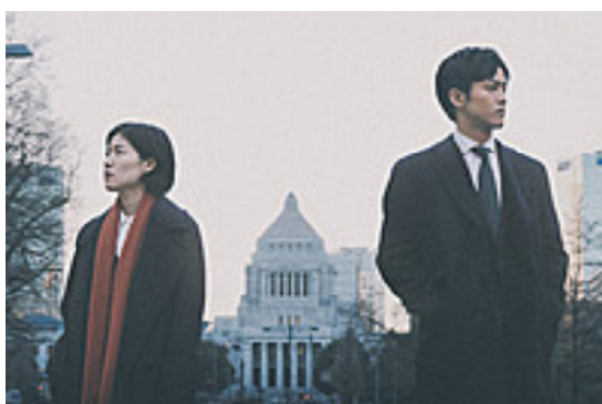
映画の1場面

相模原市は、玉城町を10分待たせればよい町... 鈴鹿市民のコミバスをよくする会 鈴鹿市は2つの行政区を1つのエリアとする地域循環バスと、それをつなぎ市内中内路を走る循環バスの組み合わせを提案。 鈴鹿市江島本町31-36 電話:059-386-0529