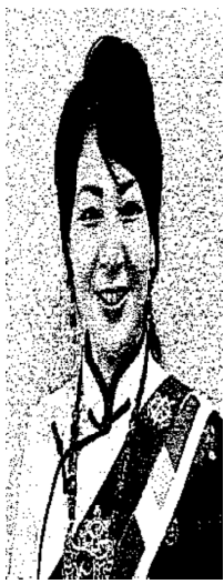
バイマンヤンジーさん

ありの講演でした。講演の最後には、会場にしみわたる素敵な声量で、チベットの民謡、日本の「ふるさと」を歌っていただきました。