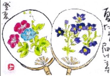
絵手紙 提供 宮崎ヨシ子

その後、緑に包まれた高賀溪谷へ行き、透明な水と白い岩の、美しい流れを見ながら、ゆっくり散策、その後、目的地の板取川の鮎のフルコース。お刺身、甘露煮、フライ、一夜干し、塩焼き、鮎雑炊等、さすが食べきれなかつたです。デザートは、キウイが多く取れる所とかで、シャーベットもキウイ、大満足の食事。