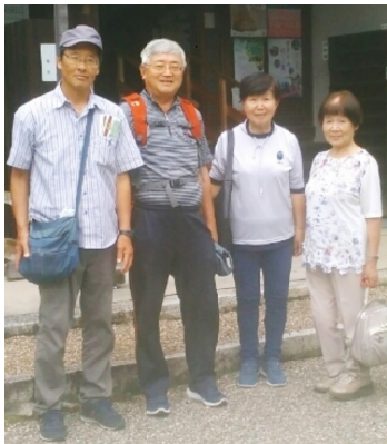
門前町坂本