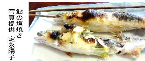
鮎の塩焼き

クラブツーツズムのパス旅行「モネの池」と鮎8尾フルコースに7人で参加しました。板取川沿いの観光ヤナでアユ料理を頂きました