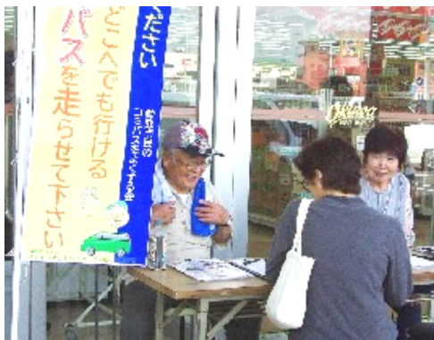
署名活動中

「誰でもが、市内どこへでも行ける『無料』のコミバスを走らせて下さい」…コミバスをよくする会のスーパード前署名活動1日目。自由ヶ丘団地前の、オークワ鈴鹿木田店様の店頭をお借りして、9時半から12時半まで、行いました。