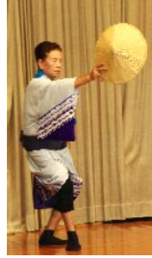
百の会お楽しみ

と決めて、今日の二〇一九年九月二十三日は、決めた日から五〇七日を無事にすごした。生きている人たちは、どの人にも明日が今日になって、今を生きており生きつづける。