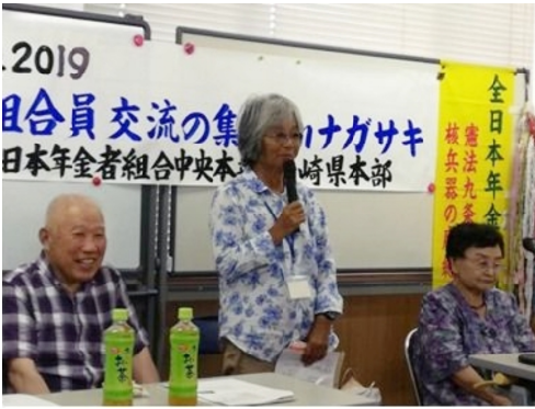
年金者組合交流