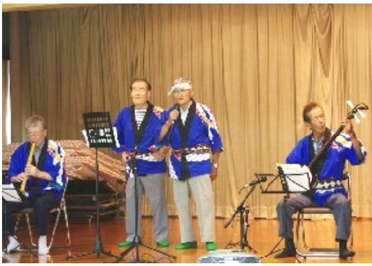
勝谷 鐵幸 写真提供 百の会お楽しみ会