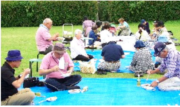
秋空の下での食事

秋晴れになった10日に、40人が参加して、健康フェスタが行われました。係が10時に集合し、一般参加のみなさんも準備に協力され、出来上がりしました。11時30分から青空の下、全員で手作りの、美味しいカレーと野菜サラダをいただきました。1時からの開会式の後、グラウンドゴルフ、ウォーキング、スクエアステップ、おしゃべりとみんな