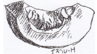
イラスト 樋口 出