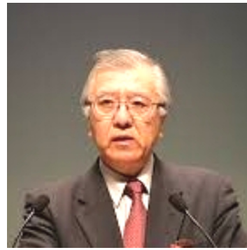
安斉さん

今回記念講演で安斉育郎先生が話された。アメリカの対日政策について、現在日本政府のやり方は、アメリカの政策をそのままやられていると思います。