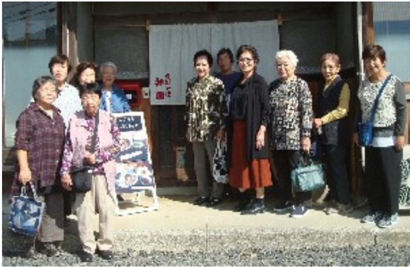
「弁慶」前で記念撮影