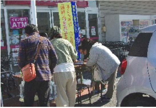
署名中のみなさん

も行ける『無料』のコミバスを走らせて下さい』…コミバスをよくする会のスーパード前署名活動7回目を23日、マックスバリュ岡田店様の店頭をお借りして、9時半から12時まで行いました。18名の会員の参加があり、近くの住宅街に8名の訪問活動で196筆、店頭で245筆、そして事前周辺にチラシを配っていたので23名の方が64筆持つてきてくれました。皆さん、「よろしくお願いします」「必ず実現して下さい」等々の声をかけていただきました。