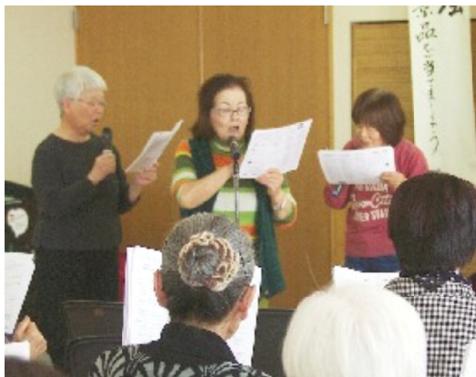
替え歌3人娘