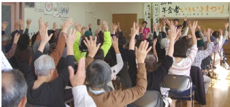
歌いからだを動かそう

「2019年金者いきいきまつり」は、11月9日の午後、10日の全日開かれました。