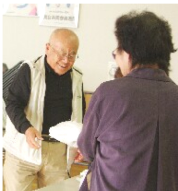
福引き大当たり