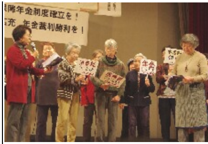
津支部女性部朗読劇

11月18日、初回以来続いた猪の倉温泉から会場を変えて、河芸公民館で開かれました。