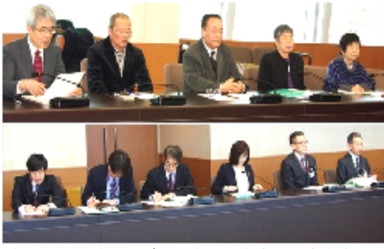
市長中央 当局市下 会勝谷 上バス勝 懇談との市町 写真提供

2月議会に上程されている新年度予算案に、新しい公共交通のための2つの事業が提案されています。