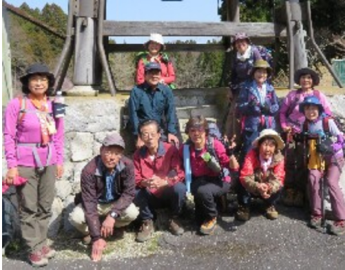
照西寺の鐘楼をバックに

4月13日(月) 7時鈴鹿川河川敷集合 歩行時間約5時間 出欠連絡先：岡本美千子、前田純へご連絡下さい。