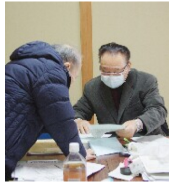
申告相談会

今年の確定申告は、3月16日までのところ、新型コロナウイルス騒ぎのため4月15日(水曜)まで延長されました。