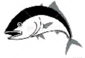
イラスト 無料ソフト

ぶりのアラ煮 アラから出たうまみが、大根やごぼうに染みだしみじみ美味しい煮物です。