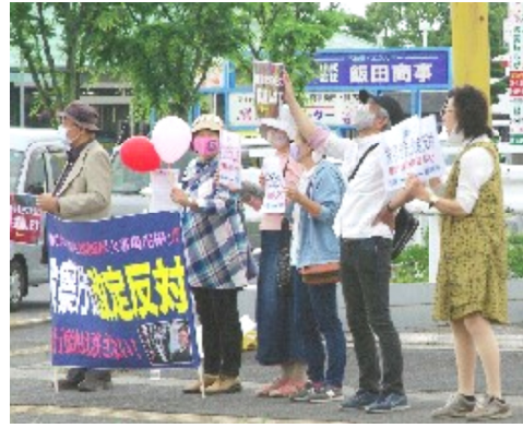
行動する皆さん

差点歩道で、「市民の会」が「検察庁法改定反対」の行動を行いました。15人の参加でした。