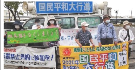
白子駅西でのスタンディング行動

新型コロナウイルス感染防止のため、三重県内では徒歩での行進が中止となりました。かなり早い時期に決定されたので、皆様には「行進はないし、白子公民館での接待もありません」とお伝えしていました。