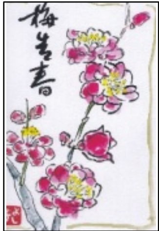
絵手紙 提供 宮崎ヨシ子

女性部 お知らせ 【1】お茶の淹れ方講座 2月24日(水) 13:30～ ジェフリー1 AB 定員30人 お茶・お菓子・おみやげ (1500円相当) あります 【2】みそ作り 3月5日(金) 11時～13時 ジェフリーにて手渡し(各自で作る) 作り方コピーお渡しします ※参加申し込みは事前に女性部役員へ。(田中美代子 記)