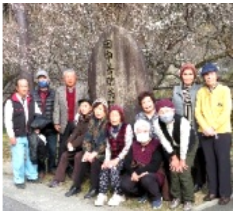
月ヶ瀬資料館前で

2月の例会は奈良県と三重県の境にある「月ヶ瀬温泉」へ行きました。12人の参加で、