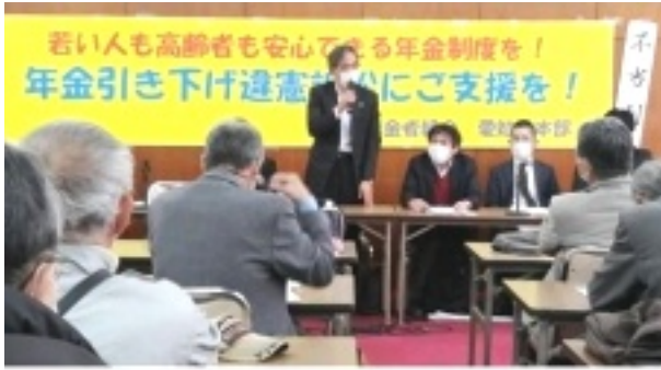
年金引き下げ違憲訴訟判決報告集会