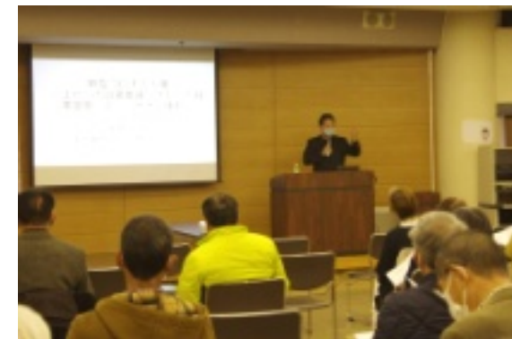
コロナと人権講演会

貧困、④貧困が子供の教育環境に影響、⑤外出の自粛・移動制限、⑥DVの増加、を挙げ、憲法的評価を解説。それらは、憲法13条、14条、22条、24条、25条、26条、29条への侵害となり、また、感染者やその危険性のある人たち等への差別、ネットでの批判は、同13、14条侵害になります。個人の生命、安全、健康、雇用、教育、財産、暮らしを守らなければならない政府は、科学的根拠に基づかない不適切な対策を、後手後手に振ってききました。そういう政府に