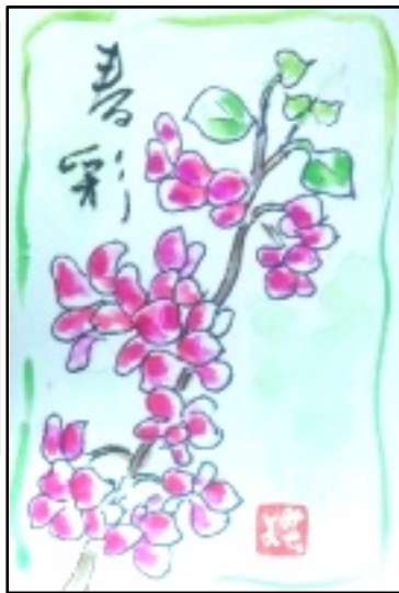
絵手紙 提供 長岡美千代 思いつつ、時代の中で蔑まれ、男性の添え物、慰み物としての地位に甘受してきたせいもあるのかもしれない等と憶測している。