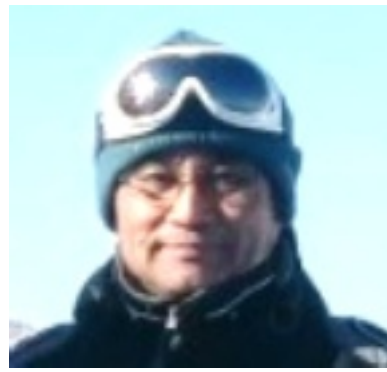
コロナに振り回された1

年でした。何でもがまんがまんの自粛生活にも慣れてきました。冬はスキーだけは何かして行きたかった。でもさすがに宿泊は辛抱して、近場で日帰りスキーを何回か楽しみました。