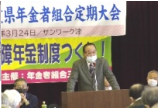
右交通会議資料 左県定期大会