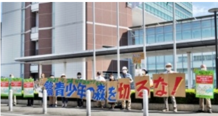
市役所西街頭行動