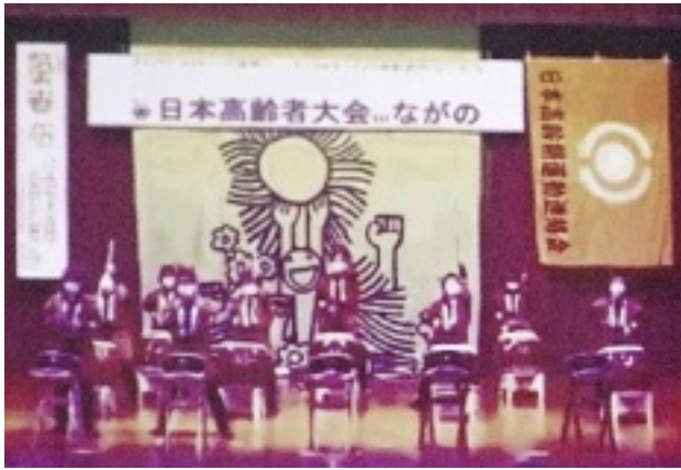
長沼こまち太鼓