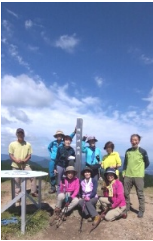
経ヶ峰頂上にて記念撮影

胃袋を満たした後、12時20分下山開始。北尾根出合いから朝来た道とは違うルートをと