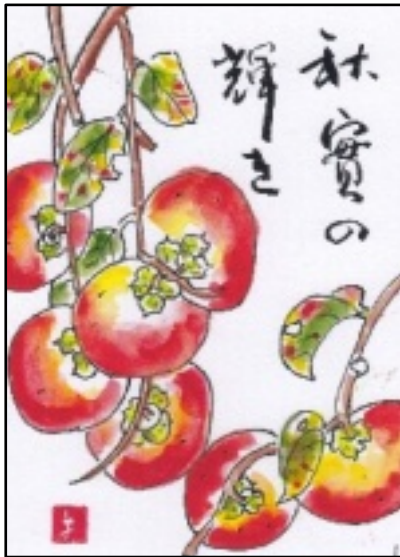
絵手紙 提供 宮崎 ヨシ子