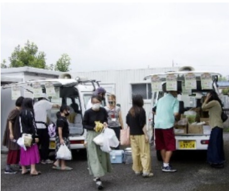
パントリーの会場

参加者は48人で全員にお渡しすることができて良かったです。約20人が初参加で27人がりぴーターです。だんだんと浸透してきて心待ちして見える方がたくさん見えます。