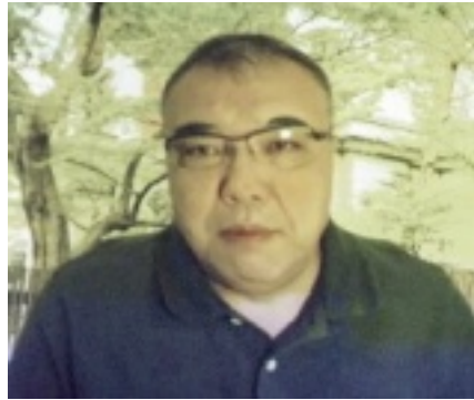
中野晃一さん