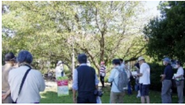
サッカー場を造るな行動発足集会