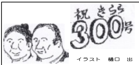
イラスト 樋口 出

300回も年金者組合のみさんの声と想いを繋いできた『きらら』 は、毎回の発行、配達の大変さもありませんが、とても貴重な財産だと思えます。 私も議会のニュースを作る