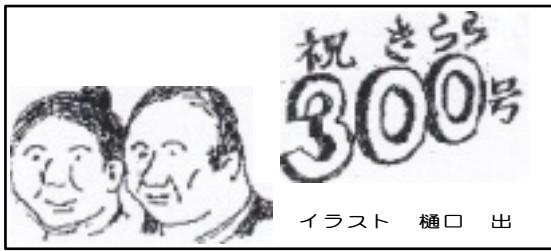
イラスト 樋口 出

「まだ退職できないが、組合に入ると約束してくれた、いつ退職するのやる」と、わたしに言った。その人が勝谷さんだと、思い出しました。