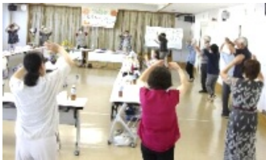
誕生会恒例の踊り

7月17日、午前8時半頃より約2時間弱、高森工里さん宅の、庭と道沿いの草取りを、