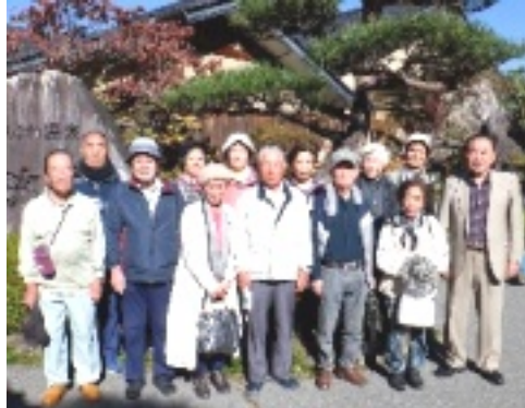
松川温泉清流苑前にて

10月20日は、最近まれにみる絶好の晴天でした。午前8時と1時間早い出発で、途中