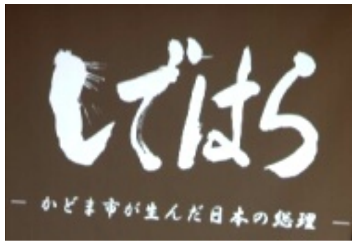
DVDのタイトル