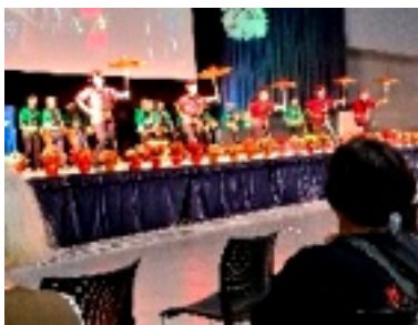
母親大会全体会