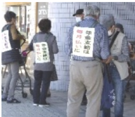
宣伝中

全国一斉年金署名活動を実施しました。久しぶりの活動でしたが、10名の参加がありました。街頭で呼びかけを行い、チラシを配布しましたが、今回は非常に受け取りが良かったです。たくさんの方とお話している中で、多くの不満を抱いている事が分かりました。年金は下がっていくばかり、そして、物価高騰の医療費は2割負担となり、その一方で、多額の税金を使って安倍元首相の国葬を強行した政府への不満が目立ちました。