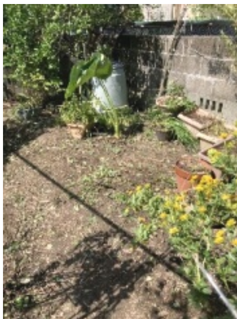
きれいに草取りされ、喜ばれた庭