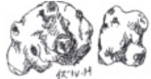
イラスト 樋口 出

作り方 ①菊芋は皮付きのまま一口大に切る。 ②ポリ袋に①と薄力粉を入れて、混ぜ合わせる。 ③鍋底から3cm程の揚げ油を注ぎ、170℃に熱し、②を入れる。きつね色になるまで2分ほど揚げたら、油切りする。 ④フライパンを中火で熱し、Aを入れて煮立たせる。 ⑤③に白いりごまをを加えて、中火のまま混ぜ合わせ、全体に味がなじんだら、火から下ろす。お皿に盛りつけ出来上がりです。とても美味しかったです。