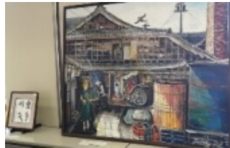
伊藤博さんの油絵 (100号165cm x 133cmの大作)

作品展では、絵画、写真、書道、パッチワーク、小物等、力作揃いで感心、でも残念なのは、組合員さん以外の外部