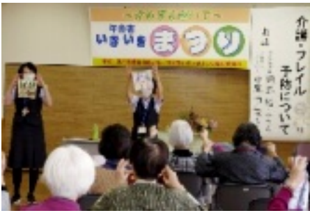
フレイル予防のお話