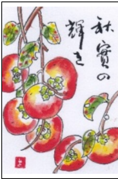
絵手紙 提供 宮崎 ヨシ子

しょうか？ 私達人間に対して宇宙からのメッセージがもたせません。人それぞれの考え方や行動にかかっているのだと思うと胸に迫るものがあります。この美しい大切な地球を「子々孫々」のために守ってほしいと願うものです。