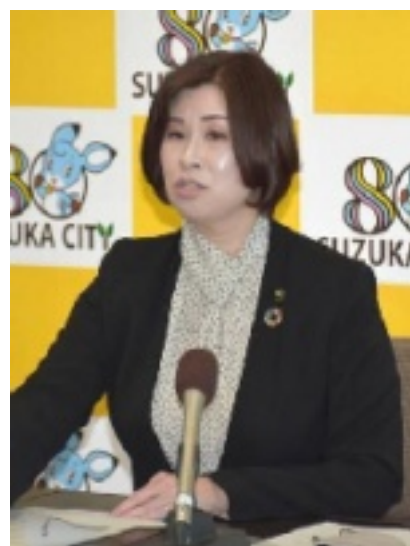
記者会見の市長

を閉じ込める柵をして森にも、子どもたちにも、周辺の住民のみなさんにも心配をかけて、ここにきて、業者の責任にして市長は逃げるのですね。潔くないです！