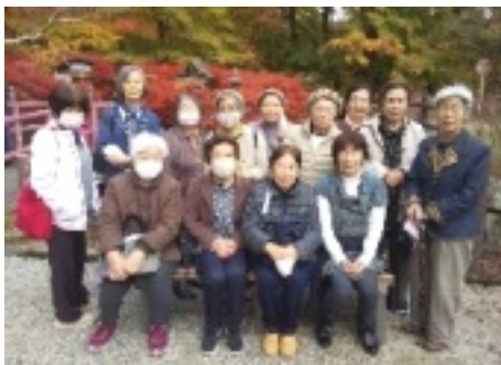
紅葉の前で