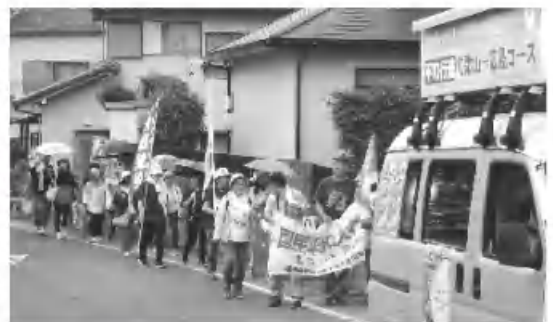
6/13 旧伊勢街道を歩く平和行進

年金者組合の皆さんには、白子公民館でお茶やお菓子を準備してください。行進団の後ろを車でついて(疲