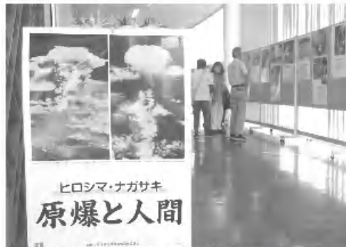
4日間で多くの来場者がありました

全日本年金者組合 三重県鈴鹿支部 第317号 2023.8.12 事務局 〒513-1124 鈴鹿市自由ヶ丘 1-16-30 桑原 篤 tel 374-2894 編集責任 橋詰 圭一 鈴鹿市岸田町2866-4 Tel.090-6577-3617 Fax 386-8561 メール k hasizume 11@yahoo.co.jp