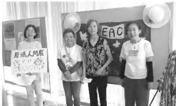
8/6午前受付担当の年金者組合の皆さん