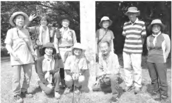
長谷山頂にて

無風で汗が出る。10分毎に水分補給しながら30分位で車道に出ると風があり涼しい。やがて展望広場に到着。景色良く日陰で涼しい。そこから5分位で頂上着。高山ガイドの適切な案内で皆元気、感謝! 9時半ごろ広場で昼食を、植木さんの差し入れの素麺で氷もあり冷たくて美味しい。いつも有難うございます。デザートは冷やしぜんざいスイカ入り、甘い!