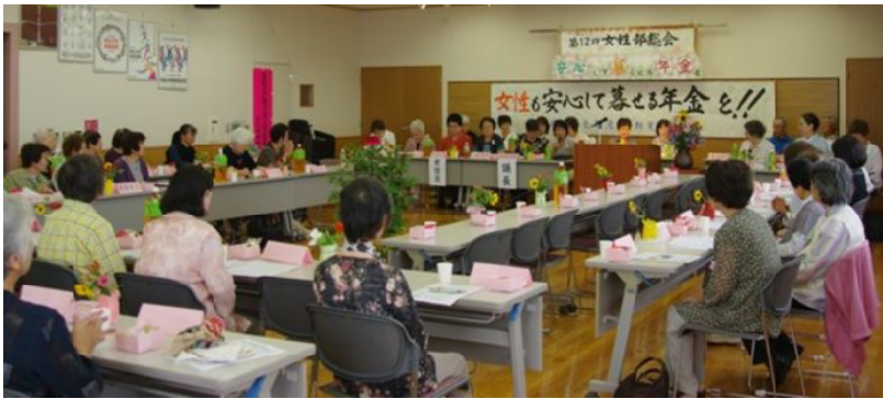
総会の開会風景