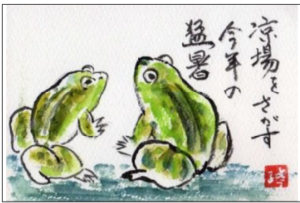
絵手紙