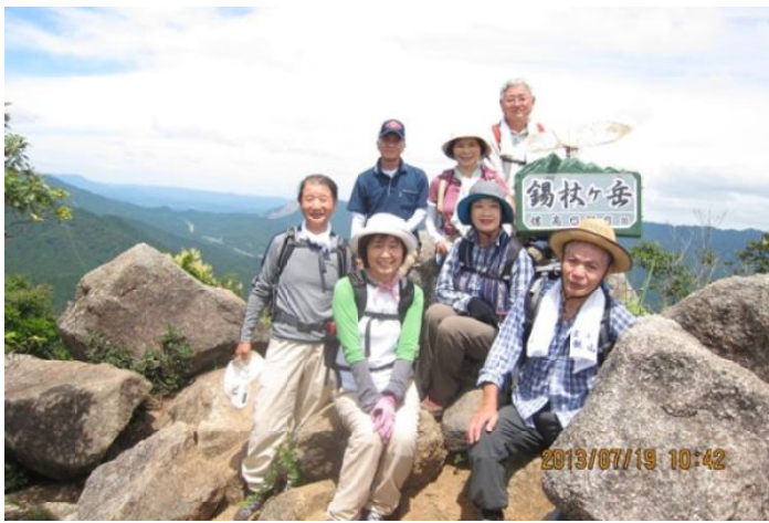
錫杖ガ岳頂上にて

7月19日(金)、朝から快晴の中、鈴鹿市文化会館第三駐車場に集合、参加者は7名(男4、女3)でした。9時に向井加太登山口に到着。林道を約30分歩いた後、柚の木峠に到着しその後、樹林帯の中の険しい登山道と岩場を登り10時40分に錫杖ガ岳頂