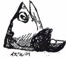
イラスト 樋口 出