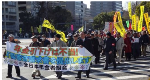
デモ行進

手渡し会場の12人の係官に、各支部代表がそれぞれ請求書の束を提出し、数を確かめられた上、受取書が交付されました。対応は紳士的でした。請求者は、全国で12万6千人、三重県で1192人、鈴鹿支部で193人(うち組合員外30人)に達し、3県とも組合員数を上回り、大成功の取り組みとなりました。鈴