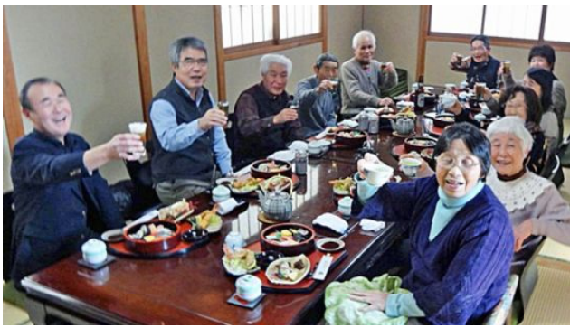
新年会楽しむ皆さん