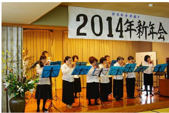
オカリナ演奏

熊給、桑原さんの名司会の進行で、午前は、3組の踊り、お話、ギター演奏と歌（みんなで「お酒の歌」を歌いました）、オカリナ演奏（5曲）、カラオケ（6組）が行われ、出演者の皆さんの好演に大きな拍手が送られました。が、機械の不調で不快な思いをされたカラオケ出演者にお詫びいたします。