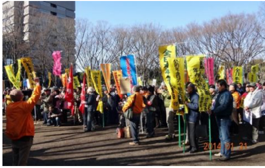
東海3県集会

1月31日に、名古屋市長東小公園で、東海3県の組合員407人が集い、請求書提出場所の東海北陸厚生局まで、年金2.5%削減の不当性を訴えて、1.4kmをデモ行進しました。三重県からは58人、鈴鹿支部からは21人が参加しました。北勢5支部は県本部がチャーターした大型バスで行きました。