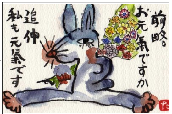
絵手紙