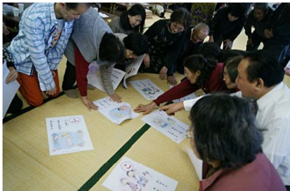
かるた取り

※靴が換えられた人がありました。気がついた人は勝谷（TEL387-0383）まで連絡下さい。（勝谷鐵幸 記）