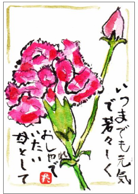
絵手紙

後半の「鈴鹿の昔話」は、神戸の寝釈迦で有名な「龍光寺」の由来。8月のエンマさん会式で有名な「林光寺」の伝説。日露戦争の軍神と伝えられる「杉野兵曹長」。「漂流民・大黒屋光太夫」の4話を朗読しました。大黒屋光太夫については、井上靖著「おろしや国酔夢譚」が映画化され、伊勢若松には記念館もある。