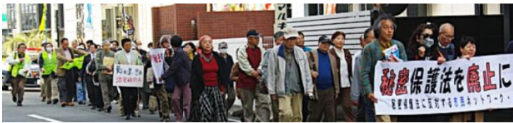
津駅往復デモの教文会館

秘密保護法を国連は、「21世紀に作られた最も最悪な法律」と批判、戦前の軍機保護法、国防保安法と共通する問題を秘密保護法はもっている。政府は、「国民の目」や「国民の動き」を恐れている。今後秘密保護法廃止の運動を広めていくことこそが緊要だ。(山本あけみ 秘密保護法反対鈴鹿市民の会代表 記)