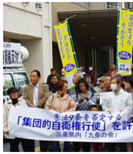
津駅往復デモの出発前

三重県九条の会の総決起集会ともいえる、合同の講演会が4月5日(土)教育文化会館で行われた。講師は渡辺治(全国9条の会事務局長)さんで、演題は「安倍政権と日本のゆくえ」。その要旨。