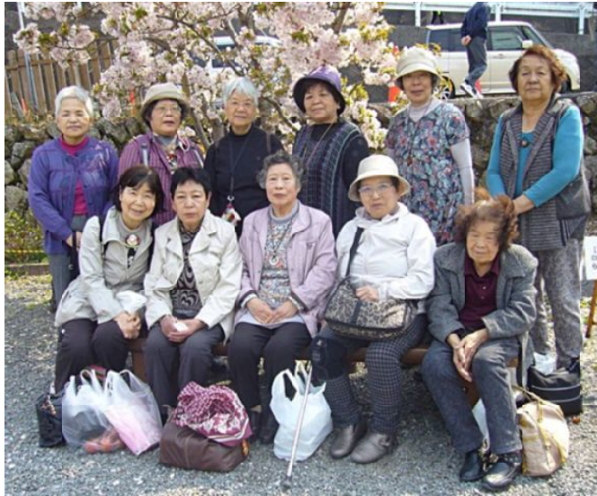
花をめぐる会参加のみなさん

村をさる人々の表情は力強い爽やかさを感じました。5月はお休みして、また素敵な映画を見つければ、サークルの皆さんにはきららでお知らせします。(辻井 豊子 記)