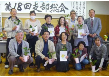
仲間づくりで感謝状を贈られた方々

組織の支援する会をつくる）を視野に、憲法25条の社会保障の理念や国連の社会権規約委員会の日本政府に対する勧告（高齢者・社会保障部分）を力にして、取り組みを強化していきます。（勝谷 記）