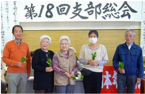
退任する皆さん

不当で認められない決定だとして、第2次の審査を、1次の10%の人数（鈴鹿は21人）が、5月12日に、年金機構津事務所に請求しました。第1次請求運動を団結して取り組み、組織の力を強めました。消費税の増税、医療・介護の改悪、低年金による生