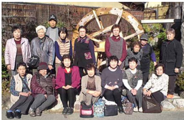
温泉横の水車の前で