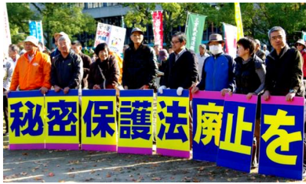
鈴鹿の参加者の皆さん

11月15日(土)津のお城西公園で「戦争する国づくり人づくり反対集会」がありました。600人ぐらゐの人が参加しました。集团的自衛権行使反対、秘密保護法を施行するなを訴える多くの呼びかけ人・賛同者・協賛団体の共催で取り组まれました。