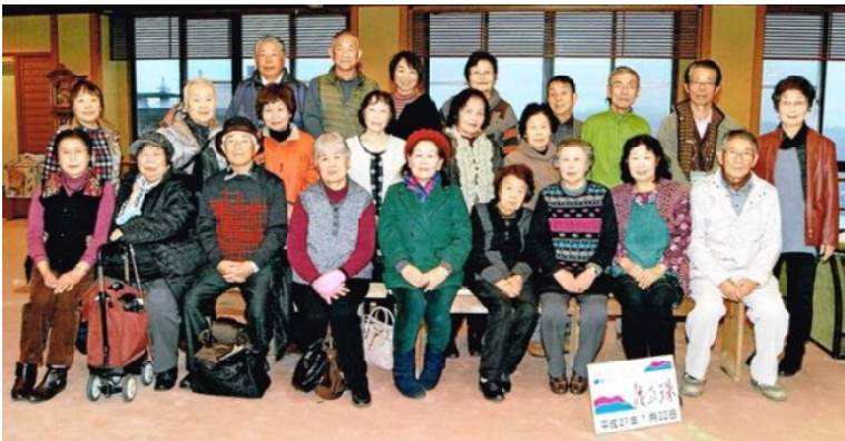
鳥羽のホテルにて記念撮影

熊ちゃん誘ってくれてありがとね。久し振りに会えた人も何人かいたり、初めてお会いする人も多勢いて、そんなみんなと賑やかに御馳走をたらふく。大満足。初日の雨の日も、広いホテルの階段の上り下りで、二日目は、カラオケ会場を抜け出して、安楽島の散策で、一日五千歩歩き