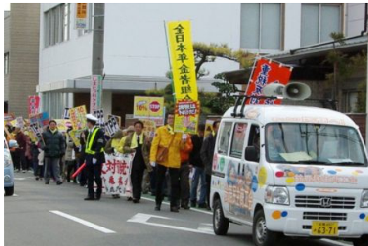
パレードする参加者

森川・新人はしづめの3人の市議立候補者の出席。2人から3人になれば、もっと市民の声が通るようになるかと期待されました。