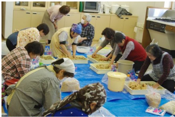
味噌づくりの体験

諸事情で3月末に、父も一緒に京都に戻ることになりました。短い期間でしたが、年金者組合の一員として温かく迎えて下さいまして、有難うございました。また、京都でも出来る限り活動を続けたいと思います。