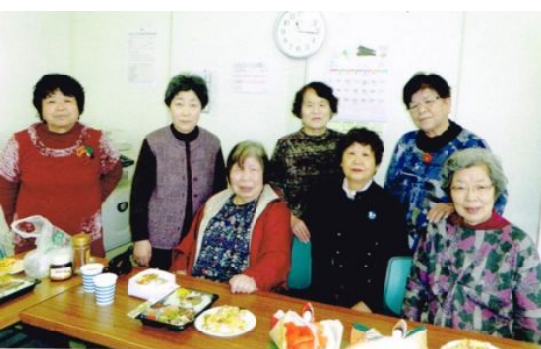
御馳走を前に手芸教室の皆さん

3月の例会は、5日、ジェフリーすずかにて、7人の出席でした。 今回は、漢字のドリルだけをしました。後は、漢字のドリルからいろいろな方面に話が展開して本を読む時間がありました。 来月は、今月の分も頑張つて本を読みましょつ、ということで開催しました。 次回は、4月2日(木) 9時30分、ジェフリーすずか研修室Aです。 (太田 和美 記)