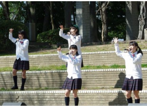
制服向上委員会

集会では、社会派アイドルグループ「制服向上委員会」が「ダッ！ダッ！脱・原発の歌」を「♪忘れないよ原発事故のこと 覚えておこう被