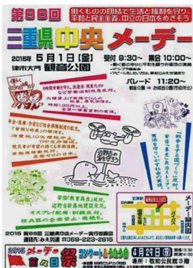
メーデーポスター