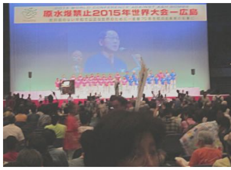
熱気あふれる大会場

きました。ありがとうございました。第1日目と第3日目は広島県立総合体育館(グリーンアリーナ)で大会が行われ、第2日目は各会場に分かれ分科会が持たれました。