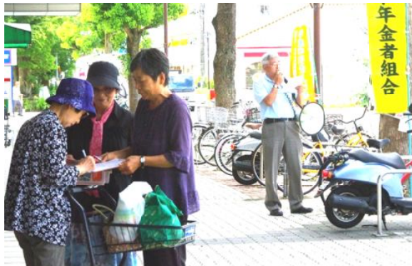
8月の年金宣伝