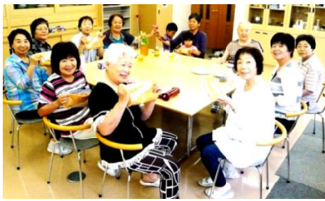
奈良漬けつくりでおしゃべりカフェ