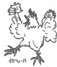
イラスト 樋口 出

作り方 ① (A) (B) をよく混ぜる。 ② 食べやすい大きさに丸めて、軽く潰したら、青じそ ではさみ、ゴマ油をひいたフライパンで両面を焼く。