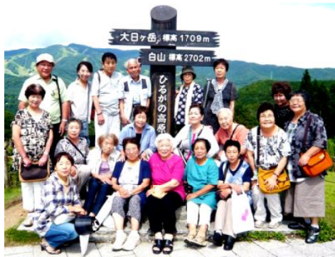
大日ヶ岳をバックに記念撮影

8月例会は19日、岐阜県東の外れ、平湯温泉の「ひらゆの森温泉」に20人で行きました。朝7時に出発して11時半過ぎに到着し、食事と温泉を3時間楽しみました。お湯は硫黄の匂いもして、入泉後の肌はサラサラして、久しぶりに温泉らしい温泉だと喜ばれました。気温も23度から24度で涼しい一日でした。