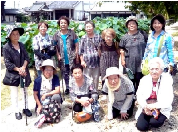
ハスの花をバックに

次回は、9月3日(木) 9時30分、ジェフリーすずか研修室Aです。(太田和美 記)