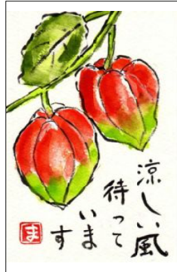
絵手紙 提供 谷口 正江

ロコロっと、転がしてネ」と 言つと、優しくボールを転が して、ピンまで届かない子、 ピンの近くでボールを投げる 子。風も加わりピンが倒れる と、全身で喜びます。その笑顔 を見ていると、こちらまで心 が癒されます。