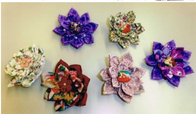
布の京かんざし