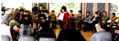
手遊び「隣組」「お猿のかごや」