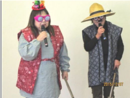
大受けの演技誰でしょう