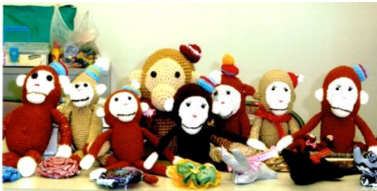
手芸教室のんびりオサル達