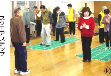
スクエアステップ