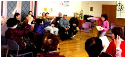
クイズ「何のトリですか」