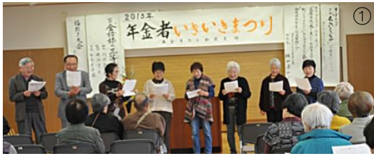
オープニング コール「えらいこつちゃ」