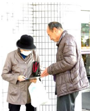
署名の説明

今年度の約4億円の赤字を加えると、合計で約9億円の赤字になり、基金は赤字の補てんに当てたので値上げは避けられないということです。12月議会で橋詰議員が質し